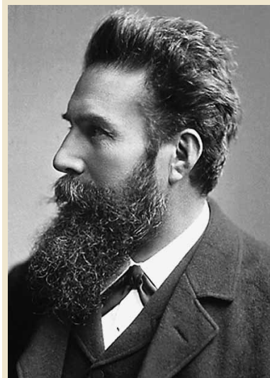
ВИЛЬГЕЛЬМ КОНРАД РЕНТГЕН

Сразу после защиты диплома Рентгена пригласил к себе в лабораторию профессор Август Кундт. Они