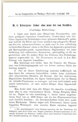
«О новом виде лучей». Впервые опубликовано в 1895 г.