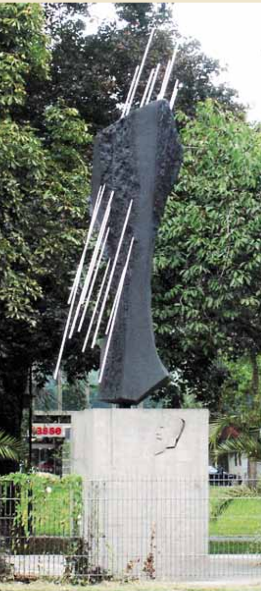
Памятник Рентгену в Гиссене

Насколько реальна история, описанная М. Веллером, судить трудно.