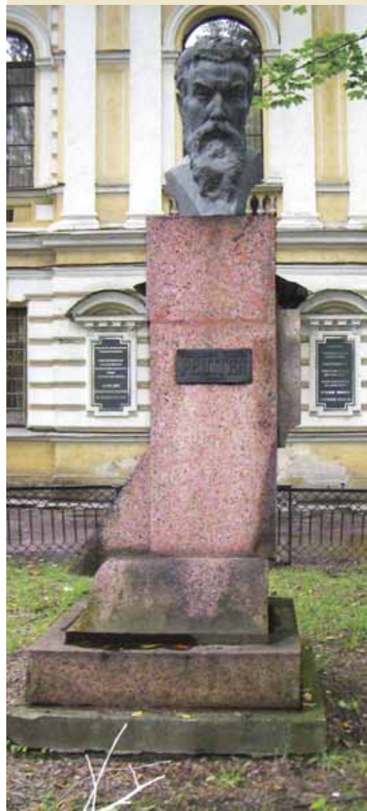
Памятник Рентгену в Санкт-Петербурге