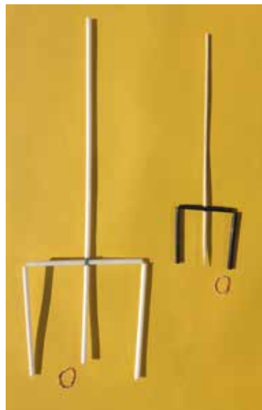
Рис. 1. Трезубец

В каждом наборе одну трубочку разделите двумя метками на три равных отрезка, по каждой из меток сделайте неполный разрез и согните трубочку буквой «П». В первом наборе к середине верхнего отрезка «П» резиновым колечком прикрепите другую трубочку, чтобы получился трезубец, как на рисунке 1 слева. А в другом наборе проколите перекладину «П» шпажкой (рис. 1 справа).