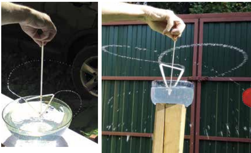
Рис. 3. Брызгалка в работе

А теперь погрузите брызгалку в сосуд с водой и покрутите. При вращении она будет брызгаться во все стороны (рис. 3).