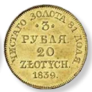
С.-ПЕТЕРБУРГЪ. Монетный дворъ въ крѣпости ST.-PETERSBOURG. Hôtel des monnaies dans La Forteresse