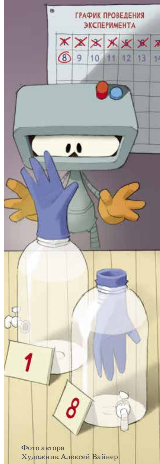
Художник Алексей Вайнер